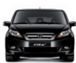
1810 (2113 mm) (avec rétroviseurs extérieurs)