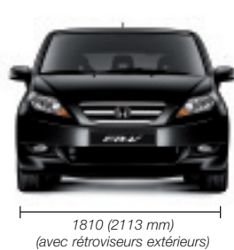
1810 (2113 mm) (avec rétroviseurs extérieurs)